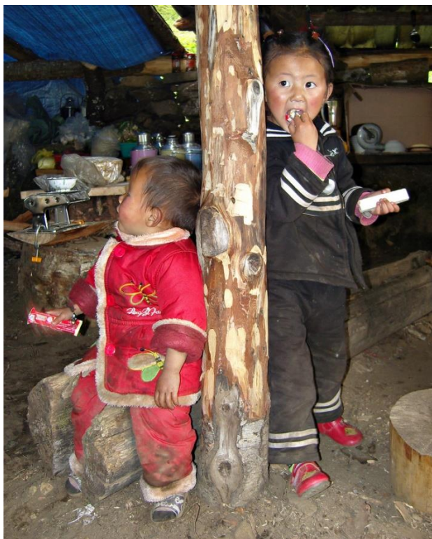
Děti z etnika Kawa

Po celý rok jsme ve spolupráci s organizací Asia Harvest pokračovali ve shromažďování finančních prostředků na vysílání čínských misionářů do nezasažených oblastí Číny i do sousedních zemí. V průběhu roku narůstalo v Číně pronásledování všech vládou nekontrolovaných křesťanských aktivit a mnozí z misionářů prožívali velké tlaky. Jsme vděční, že jsme tímto způsobem mohli podpořit naše trpící sourozence.