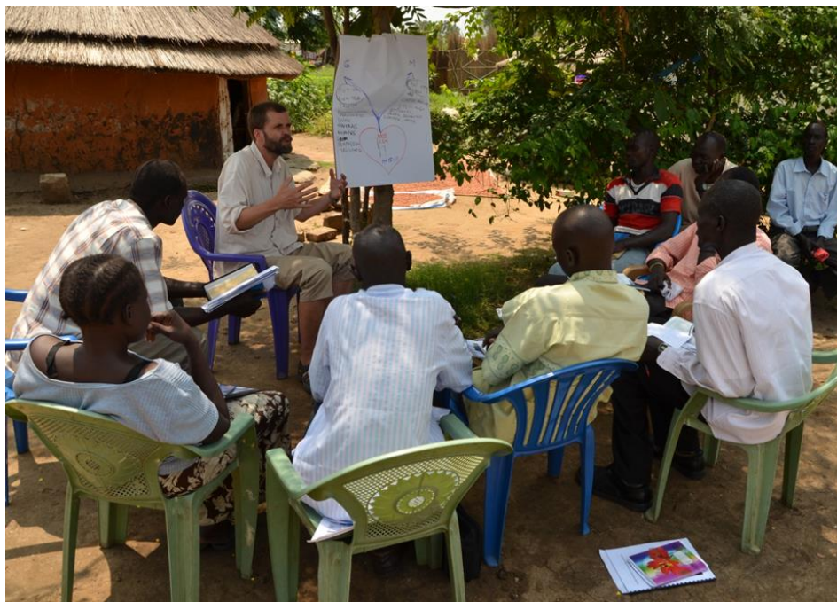
Vyučování v Toritu

V rámci tohoto projektu podporujeme aktivity Spolku pro Jižní Súdán (SJS) v oblasti vzdělávání místních křesťanů. Od roku 2012 (pokud to bezpečnostní situace dovolila) pořádají čeští křesťané krátkodobé misijní výpravy s vyučovacím programem. Studenti se buď sjíždějí do Toritu, hlavního města Východní Equatorie, nebo je Češi vyjíždějí vyučovat do církví v Narus, Kopotě, Magwi, Nimule. Absolventi těchto biblických kurzů slouží jako pastoři i biskupové, diakoni a diakonky, vedoucí mládeží a